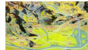
Panoramakarte Oberes Rheintal