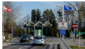
Grenzübergang Meiningen (Schweiz)