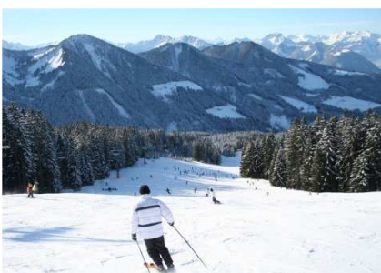
Schigebiet Laterns- Gapfohl