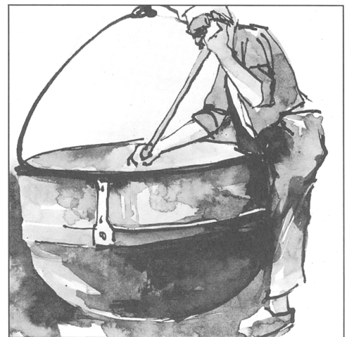
Senner auf der Alpe Weiße Fluh

Unsere Stadt ist in Osten und Süden von Wald umgeben. Fast die Hälfte des Gemeindegebietes von Dornbirn ist Wald (Gesamtfläche des Waldes: 5500 ha Wald). Die Gemeindeförster hegen und pflegen den Wald. 1380 ha Wald sind im Besitz der Stadt Dornbirn.